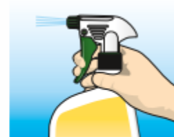
Listo para usar