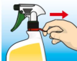
Estirar de la anilla de seguridad