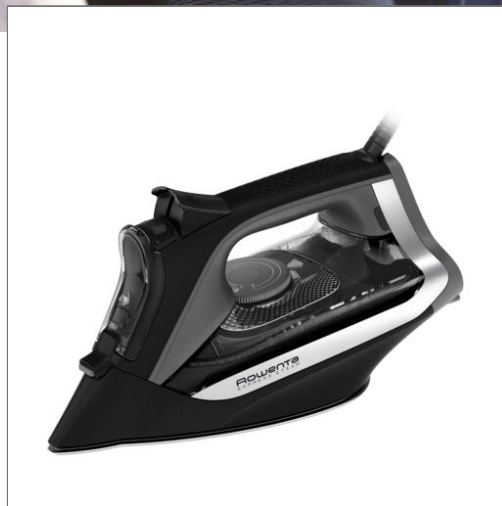
EXPRESS STEAM Plancha de vapor DW4321D1